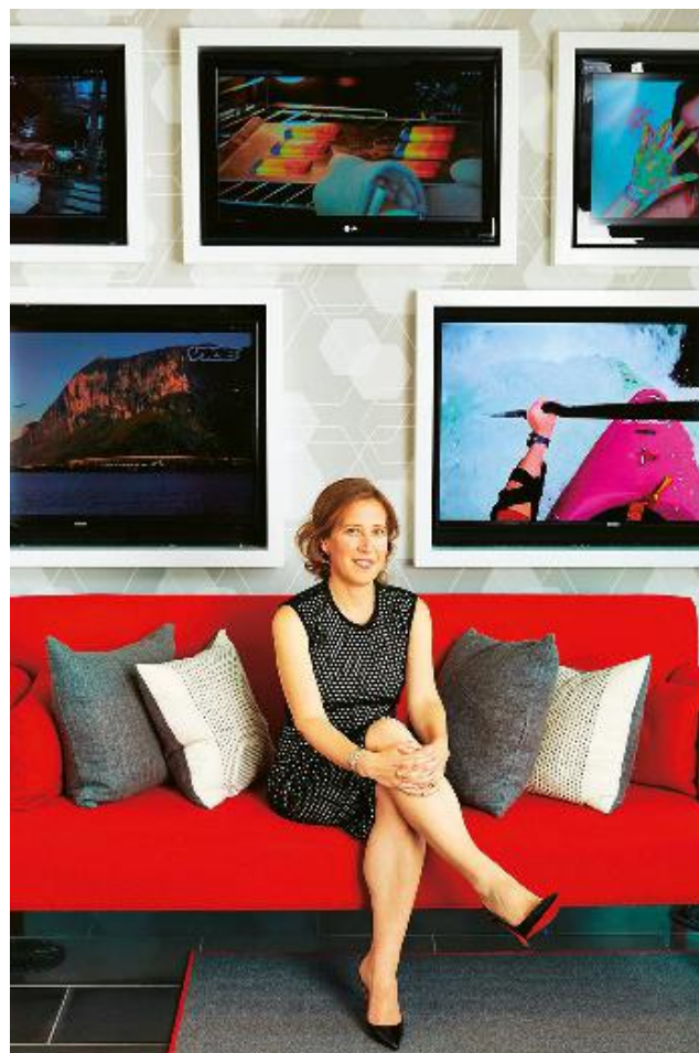
Susan Wojcicki, il ceo di YouTube, è laureata in Storia e Letteratura.

In California hanno dato un nome alle figure più richieste del momento: sono i Cpo, Chief philosopher officer. Google, Twitter, Facebook e Skype hanno inserito nei loro uffici questi manager filosofi che usano le conoscenze umanistiche per fare innovazione. E si interrogano sulle strategie aziendali.